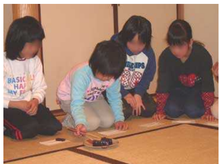
今日のお菓子はようかんです