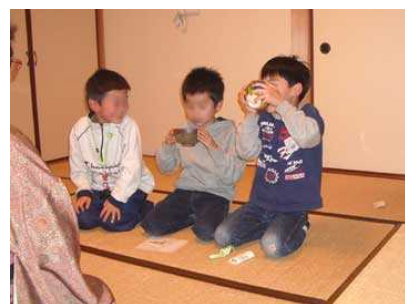
おいしーい！ おかわり！