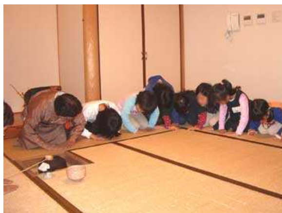
お茶を始める時にする お辞儀の練習