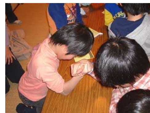
お茶の後は 腕相撲！ みんな 真剣です。