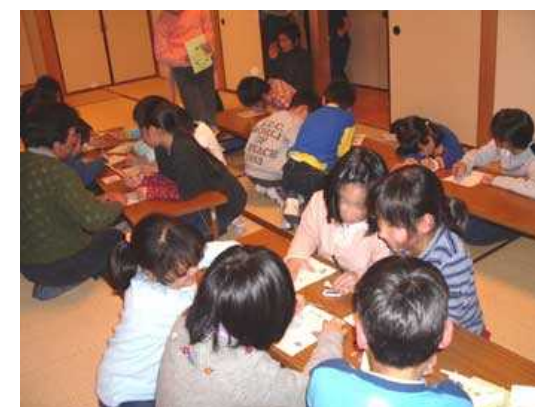
遊びもすみ、発見ノートを書きます